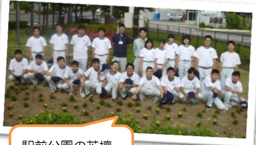
駅前公園の花壇整備をしました。