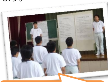
1日の始まりは朝礼から

働く上での意欲や基本的な態度を身に付けることをねらいとし、校内実習に臨みました。箆袋への箸入れ・箱折り・シール貼り・しおり折りなどの受託作業、各作業班での作業、町内公共施設での奉仕作業に取り組みました。受託作業では欠陥品を出すと取引先に迷惑をかけるということを体験し、速くかつ正確な作業の大切さを学びました。作業中の切り傷などでの保健室利用が多く、集中力を持続させて安全に作業を進めるという課題も明らかになりました。町内の奉仕作業では、どの施設でも良い評価と感謝の言葉をいただき、誰かの役に立つことへの喜びを感じることができました。これは働く上での大切な要素であり、今後の学習活動でより一層深めさせたいと思います。