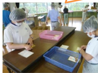
仕事は速く丁寧に！